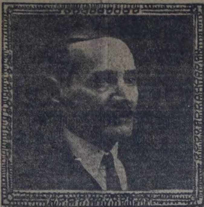
menaje al viejo y querido compañero, resolvió enviar un ramo de flores.